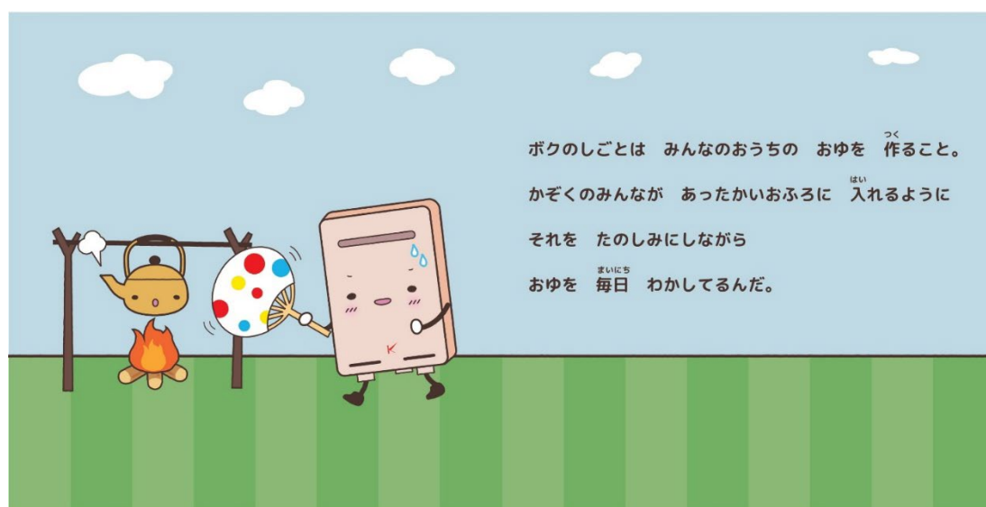
絵本のワンシーン

この絵本のプロトタイプを最初に関係者に見せたところ、「ジーンとくる」「勉強になるので子供に読ませたい」「純粋にかわいい」という声が多く上がりました。